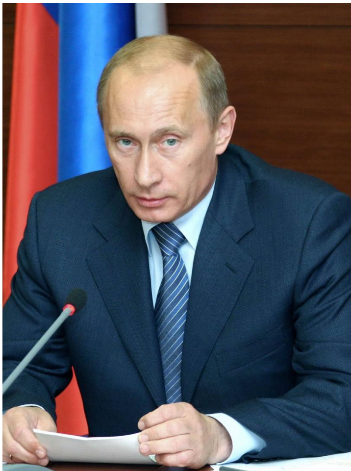
Президент Российской Федерации В.В. Путин

Одна из важнейших мер демографической политики — развитие дошкольного образования